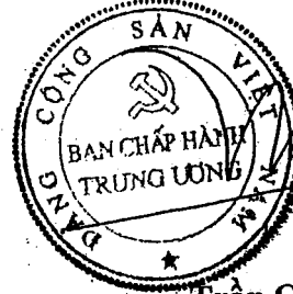
Trần Quốc Vượng